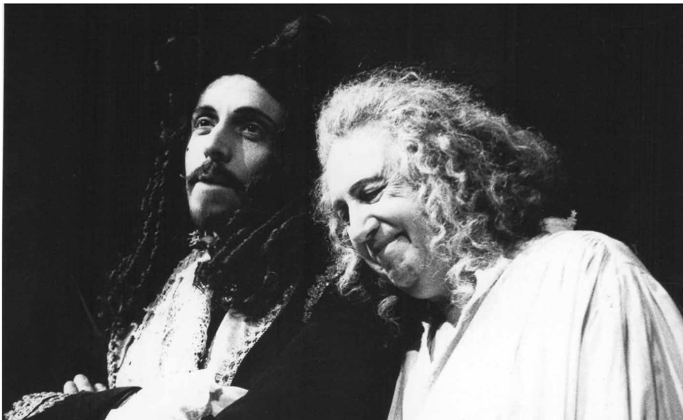
Imagem de Molière.