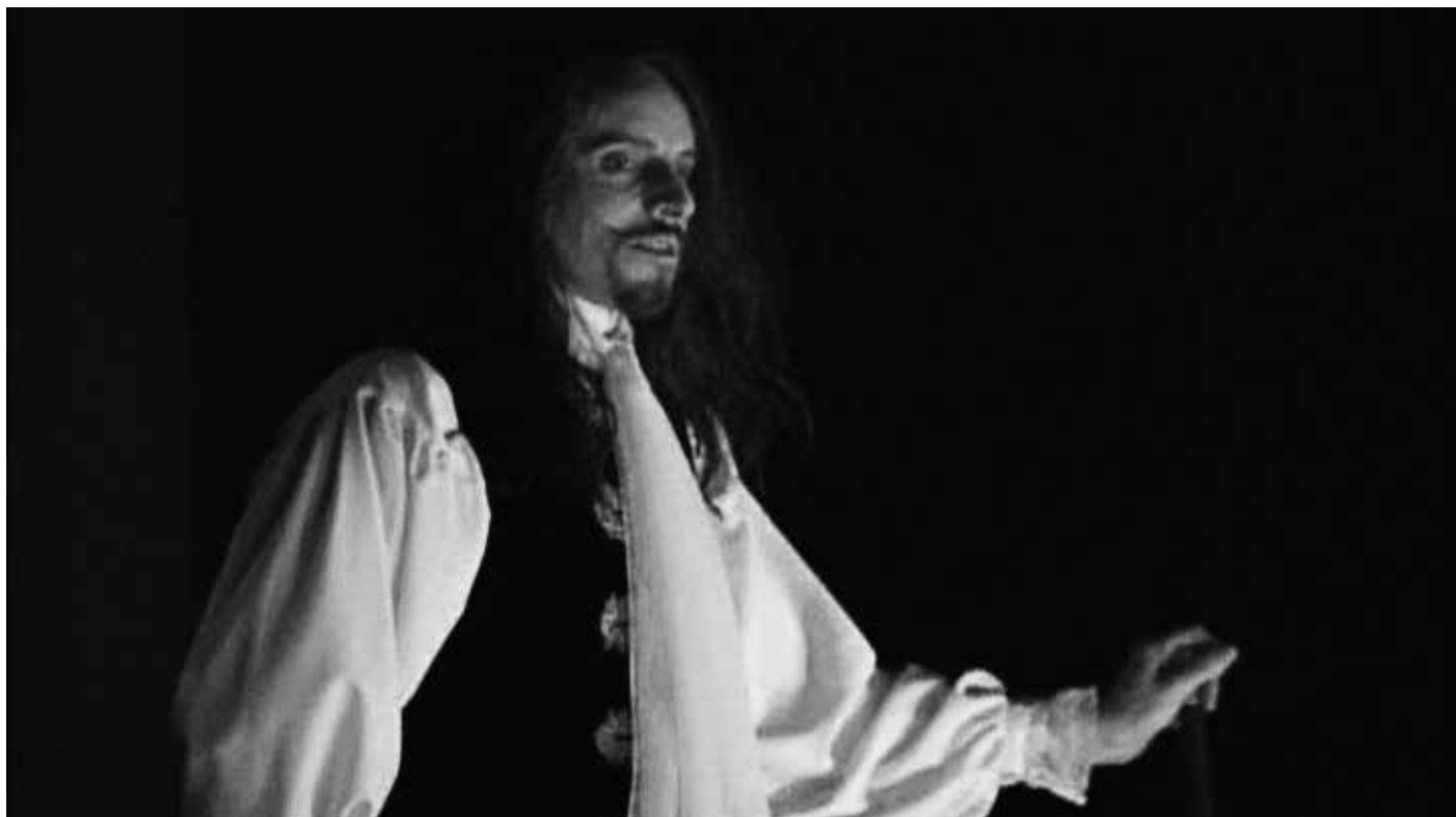
Imagem de Molière .

Mas, antes de entrar diretamente na obra de Berman, cabe falar um pouco e em termos gerais da autora. Filha de judeus europeus, Sabina Berman nasceu no dia 21 de agosto de 1955, na Cidade do México, onde reside. 3 Ainda que tenha seguido os